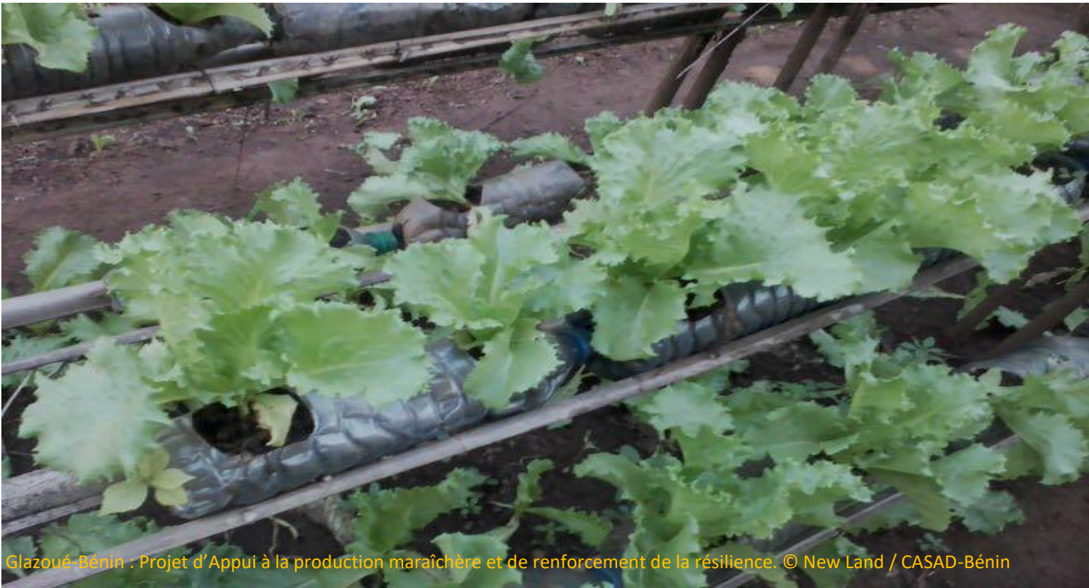
Glazoué-Bénin : Projet d'Appui à la production maraîchère et de renforcement de la résilience.